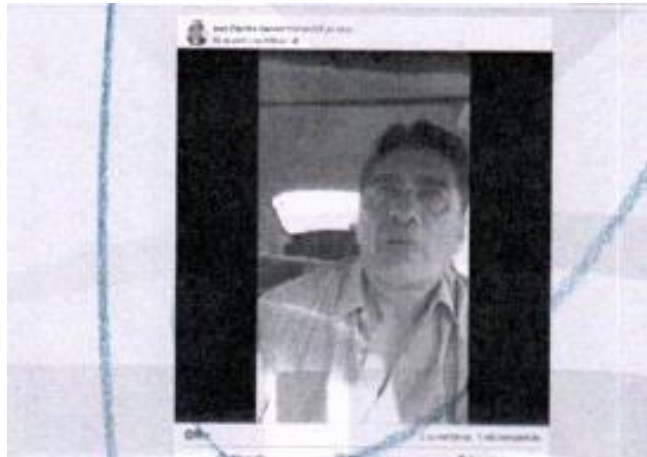
Imagen que aparece

Publicación 02, consultable en la liga-link de internet https://www.facebook.com/share/p/vCosi3bTokWkMpz9/?mibextid=oFDknk