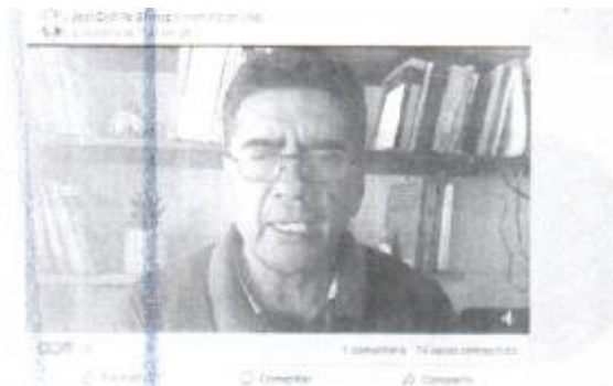
Imagen que aparece