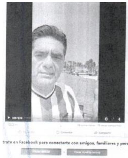
Imagen que aparece

Hecho 04. Transmisión en vivo de dos de abril, consultable en el link https://www.facebook.com/story.php?story_fbid=410666578378722&id=100000381681044&mibextid=Cx5MWH&rdid=jn0SJRWYihEeMse