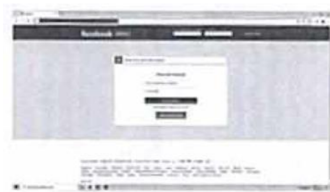
Captura de pantalla del primer URL o link de internet

Lo mismo acontece con la publicación del video denunciado, supuestamente alojado en el perfil de Facebook de la candidata denunciada, pues la inspección realizada al link https://www.facebook.com/share/v/V91NUSFGdFWLk2A/?mibextid=WC7FNe , aportado por la denunciante, no arrojó dato alguno que acreditara