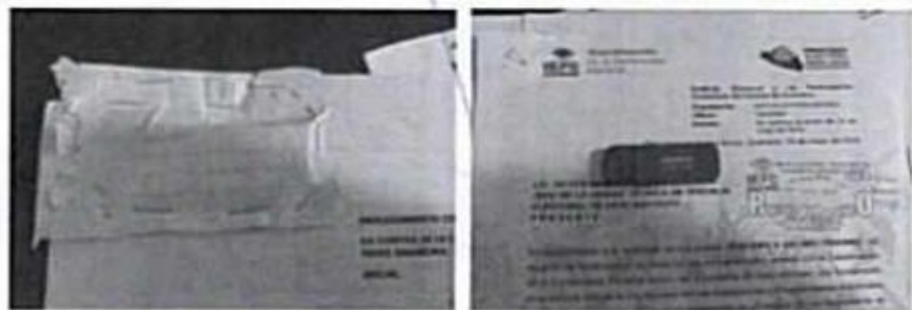
Condiciones exteriores del sobre y memoria USB remitida para la inspección.

“ TERCERO. Inspección a una memoria USB. Continuando con la diligencia, hago constar que tengo a la vista una pequeña hoja de papel en forma de sobre, cerrada con grapas metálicas por sus lados, la cual no observa texto o leyenda alguna y la que en su interior contiene un dispositivo de almacenamiento informático conocido como memoria USB, color rojo, marca “ADATA”, UV2/16GB”. Se inserta imágenes para mejor ilustración. -----