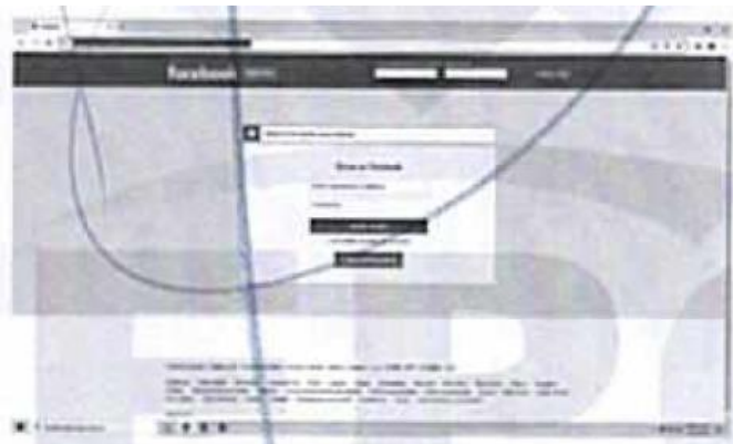
Captura de pantalla del segundo URL o link de internet

SEGUNDO. Al ingresar en la barra de direcciones del navegador Google Chrome el enlace de internet identificado como https://www.facebook.com/share/v/V91NUSFGdFWLk2A/?mibextid=WC7FNe y al presionar la tecla “ENTER”, inmediatamente se despliega información de la red social denominada “facebook” con las características siguientes: en la parte superior derecha se lee: “Correo electrónico o tel”, “Contraseña”, “Iniciar sesión”, “Has olvidado la cuenta?”. Continuamente, hago constar que en la parte central de la página se observa un recuadro con los textos: “ Debes iniciar sesión para continuar ”, “ Entrar a Facebook ”, “ Correo electrónico o teléfono ”, “ Contraseña ”, “ Iniciar sesión ”, “ ¿Has olvidado la cuenta? ”, “ Crear cuenta ”. Se inserta captura de pantalla para una mejor ilustración. - - - - -