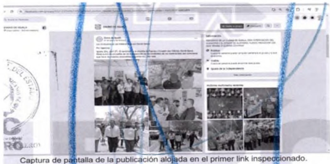
Captura de pantalla de la publicación alojada en el primer link inspeccionado.