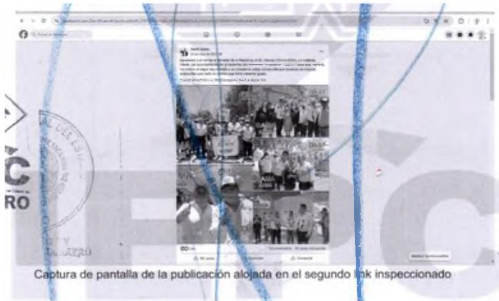
Captura de pantalla de la publicación alojada en el segundo link inspeccionado

abierto (tres en pose) de las cuales dos son del sexo masculino portando cubre bocas color rojo y camisas blancas de manga larga, cabe señalar que uno de estos con logotipos ilegibles de colores, y una persona del sexo femenino en medio de ellos; la quinta imagen, situada en la parte inferior derecha con dos marcas de agua de texto, que se leen por un lado: GAMA (G=COLOR ROJO, A=COLOR AMARILLO, M=COLOR GRIS, A= COLOR VERDE), SÍ PUEDE (COLOR ROJO), por otro DIA 2 (SUBRAYADO) DE CAMPA (EN COLOR ROJO), se ve a seis personas aproximadamente en una construcción o vivienda con paredes color azul de las cuales destacan tres, portando adornos de collares distintivos de colores y camisas blancas de manga larga, precisando que solamente dos de estos tienen puesto cubre bocas color rojo.-----